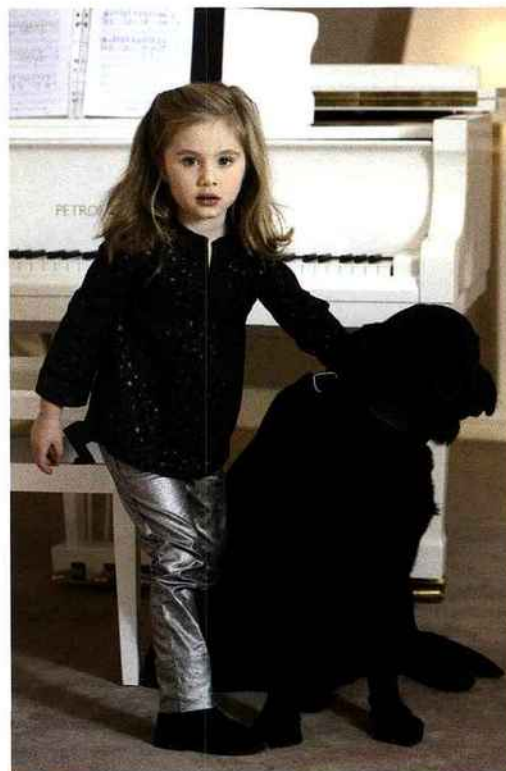
La plus brillante de la rentrée ! En tunique à strass et pantalon d'argent. Troizenfants.

Mademoiselle est fin prête pour filer à son cours de danse. Interdit de me Gronder.